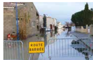
« Rue de l'Etang de l'Or (Cabanes de Pérois) ».

En cas d'évènements pluvio-orageux locaux, le ruisseau du Nègue-Cats et ses affluents le Fenouillet et l'Estagnol peuvent déborder au Nord de la commune. Ils affectent la ZAC du Fenouillet, le Parc d'activité de la Méditerranée et également en partie l'avenue Georges Frêche, la RD172 et la RD66, du rond-point de l'aéroport jusqu'à l'exutoire de l'Etang du Salin.